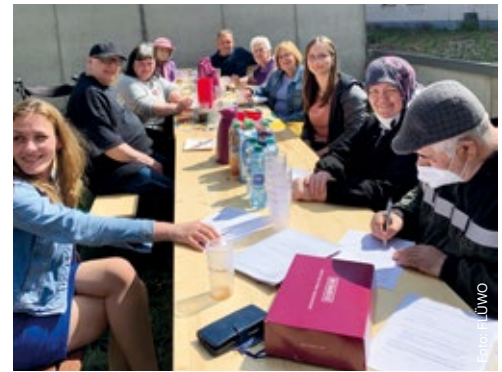
Alt und jung freuen sich über den Besuch des FLÜWO-Mobils.

Welche Projekte sollen wir als nächstes angehen?