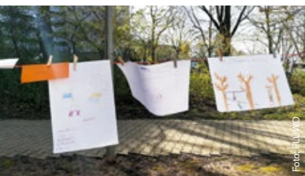
Die kleinen Künstler haben viele Vorschläge für ein lebenswertes Freiberg gemacht.

Ab Mai 2022 steht das Stiftungswägele dann für sechs Monate in Göppingen. Nach einer Willkommensfeier wird das Wägele für offene Nachbarschaftssprechstunden, Bewegungsangebote und andere Belange der Bürgerschaft wie gemeinsames Musizieren genutzt. Wie in Freiberg wird ein Filmteam dafür sorgen, dass die Einsatzmöglichkeiten des Stiftungswägeles in voller Bandbreite dokumentiert werden. ●