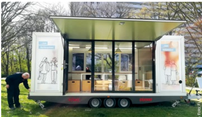
Das Stiftungswägele im Prozess des „Aufklappens“.

Brezeln, Muffins und Getränken, um folgende Fragen zu diskutieren: „Was bedeutet Freiberg für mich? Was läuft gut hier? Was sollte sich ändern?“ Gefragt zu den Themen waren die Bewohner des Quartiers, unterstützt von Schülerinnen und Schülern der 4. Klasse aus der benachbarten Herbert-Hoover-Grundschule. Nach einer kurzen Einweisung nahmen die kleinen Künstler sofort Beschlag von den vielfältigen Möglichkeiten, die sowohl die Räumlichkeiten des Stiftungswägeles als auch die Freifläche vor dem WohnCa-