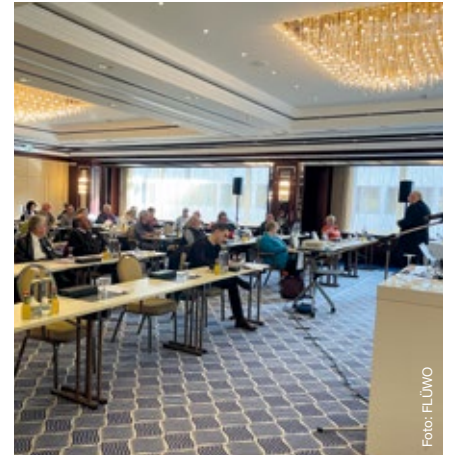
Vertreterzusammenkunft am 8. April 2022 in Stuttgart.

Wahl zu entscheiden. In den Wochen zuvor hatten alle Mitglieder einen Stimmzettel für ihren Wahlbezirk erhalten und bis zum 11. März Zeit, diesen ausgefüllt an die FLÜWO zurückzusenden. Danach ging es am 17. März an die Stimmauszählung durch den Wahlvorstand und die Wahlhelfer, bei der die Stimmzettel der Wahlbezirke ausgezählt wurden. Seit dem 25. März 2022 finden Sie entsprechend der Wahlordnung die gewählten Vertreter und Ersatzvertreter auf der Homepage der FLÜWO unter www.fluewo.de/vertreterwahl . ●