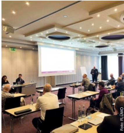
Vertreterzusammenkunft am 7. April 2022 in Mannheim.

Die Wahl der Vertreter und Ersatzvertreter für die 2022 beginnende neue Wahlperiode der Vertreterversammlung ist abgeschlossen. Am 5. Mai 2022 ist der Wahlvorstand das letzte Mal zusammengekommen, um über den Abschluss der