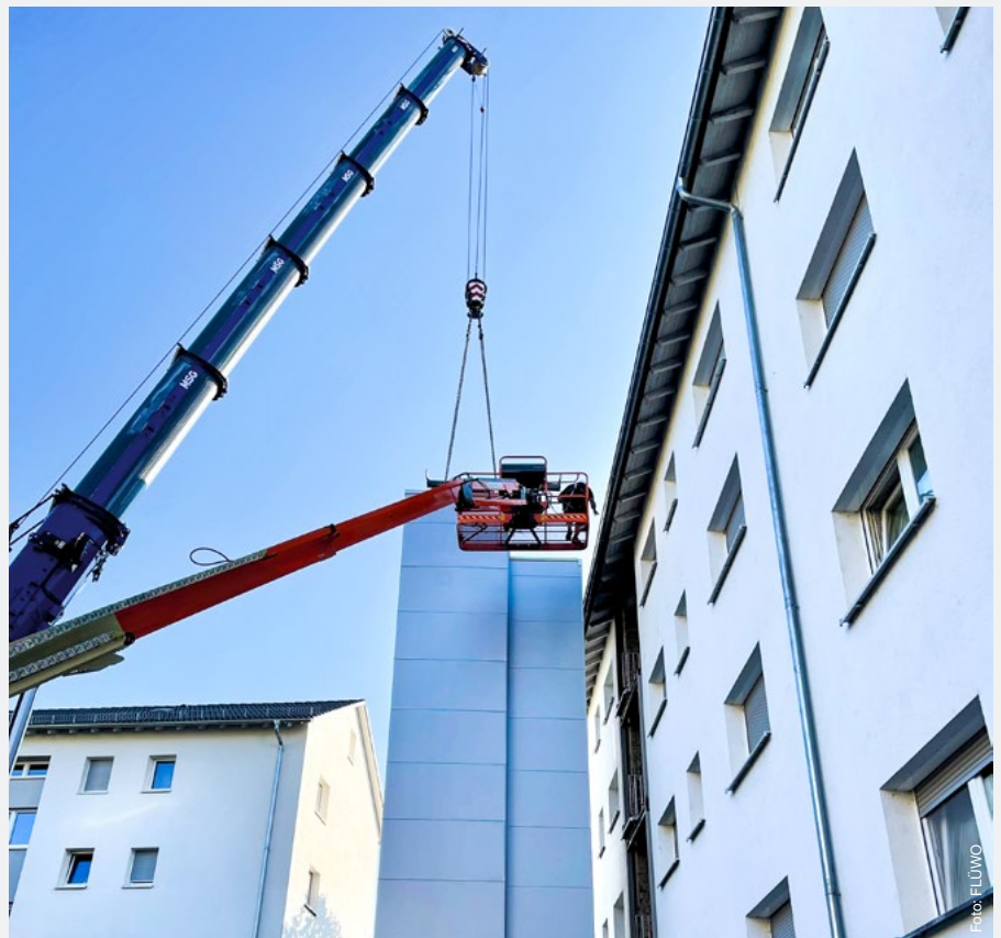
Karlsruhe, Herzstraße, Aufzugsanbau in Modulbauweise.

Das FLÜWO Sozialmanagement: Bereits seit 2014 gibt es das FLÜWO Sozialmanagement. Seitdem sind im Unternehmen Mitarbeiter für die soziale Fallarbeit angestellt, die als Ansprechpartner für die Mieter sowie für die Beschäftigten der FLÜWO zur Verfügung stehen. Der Schwerpunkt bei der individuellen Fallarbeit ist die Beratung von Menschen, die sich in einer schwierigen finanziellen oder sozialen Situation befinden. Der Verlust der Wohnung ist eine der größten Sorgen vieler Menschen. Deshalb ist das Ziel, den Bewohnern einen möglichst langjährigen Verbleib in der Wohnung zu ermög-