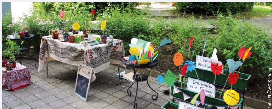
Stuttgart Freiberg, „Tag der Nachbarn“, Hauptsieger im diesjährigen Wettbewerb: der Pflanzentauschtreff

Bei einer Online-Abstimmung auf der Stiftungswebseite gingen der Pflanzentauschtreff in Stuttgart-Freiberg sowie der Straßenflohmarkt im Ulmer Traminerweg als kreativste Aktionen hervor. Die prämierten Nachbarschaften erhalten auch dieses Jahr ein Nachbarschaftsfest im Quartier, welches durch die FLÜWO Stiftung finanziert und organisiert wird. Zudem erhielten die Nachbarschaftsaktionen bei Bedarf eine finanzielle Unterstützung in Höhe von 50 Euro. ●