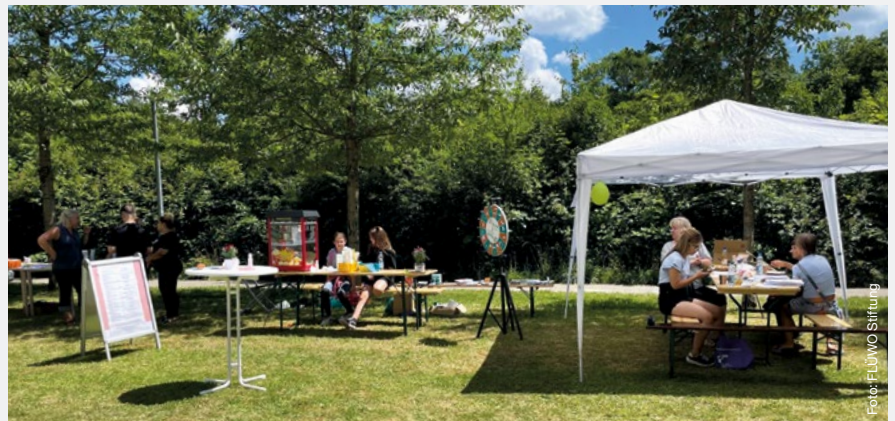
Stuttgart Fasanen Hof, Nachbarschaftsfest

Das Nachbarschaftsfest wurde von der FLÜWO Stiftung organisiert und finanziert. Die FLÜWO Stiftung dankt dem Pasodi-Team, den umliegenden Wohnungsunternehmen sowie dem Verein Integrative Wohnformen für die Unterstützung bei der Umsetzung der Veranstaltung. ●